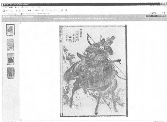
[5]Web公開版「歴史人物画像データベース」

そこで、こうした特質に着目して、古今の人物群から取材された典籍で、絵入りのものを対象として、集中的なさらに調査を行うならば、「日本人が知っていた本当に有名な人物は誰か」ということを証するための有効な指標が求められるという道筋は成り立ちそうである。