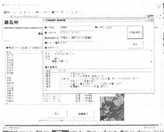
[6]検索システム付DVD版

英雄百人一首・百人一首図絵・若鶴百人一首・武家百人一首・役者三十六家選・粹興奇人伝・続英雄百人一首・近世名婦百人撰・列女百人一首・本朝孝子伝・秀雅百人一首・万家人名録・崎人百人一首・義烈百人一首・絵入赤穂四十七士詩伝・徳川十五代記・武勇魁図会・本朝百将伝・狂歌百人一首・新編歌俳百人撰・大日本国開闢由来記・本朝列仙伝・前賢故実・先賢遺芳・先哲像伝初輯・八幡太郎一代記・利運談・宮本武勇伝・岩倉具視公之実伝・明治英銘百詠撰・現今英名百首・絵本威武貴山・絵本武者備考・明治中興雲台図録・明治中興凌煙図録・源義経一代記・絵本武蔵鑑・和洋奇人伝・今人名誉百首・徳川東国武勇伝・神君長篠大合戦・玉石雑誌・絵本武勇伝・豊臣昇雲録・好古事彙・源平盛衰記図会・絵本故事談・絵本忠経・絵本徒然草・絵本堪忍記・円光大師御一代記・（弘法大師行状記）・武稽百人一首・俳人百家撰・近世報国百人一首・訓蒙皇国史略・（集古十種）・都絵馬鑑・絵本倭比事・三国七高僧伝図会・神風遺談〔計 59 作品〕