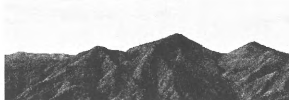
左は毛無森、中央手前から鶏頭山、中岳、