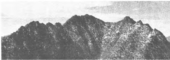
左側に西穂高岳、右側に明神岳、前穂高岳 中央が穂高岳