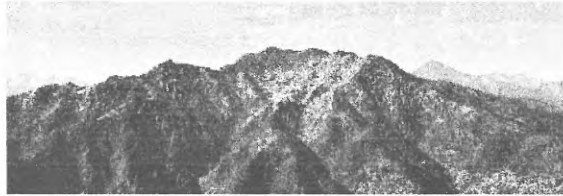
日本武尊（ヤマトタケル）の伝承から付けられた漢字地名