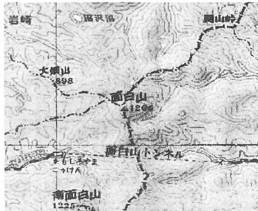
東から見た面白山