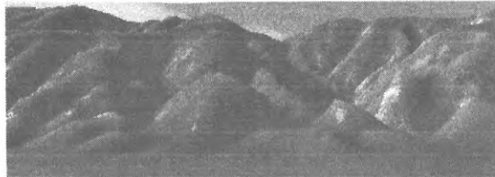
中央やや下の丸い山の麓がオモロ沢、右手の小さい山の麓が馬込（マゴメ）手前は富士川 小室沢 オモロ o-mor-o